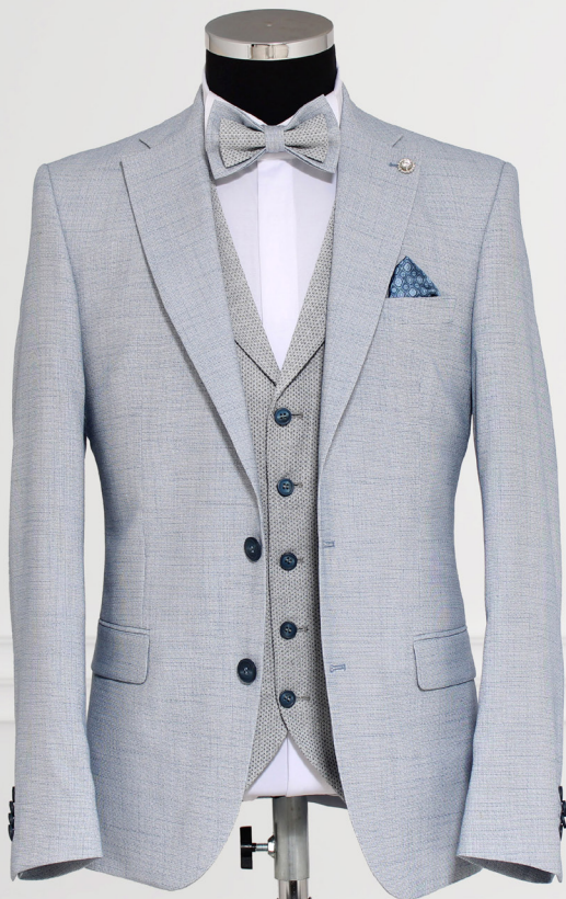
MIS 7274 lt. blue