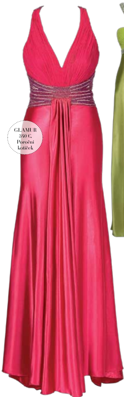
GLAMUR 340 € Poročni kotiček