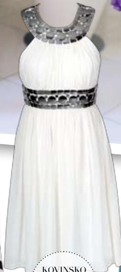
KOVINSKO 279 € Poročni kotiček