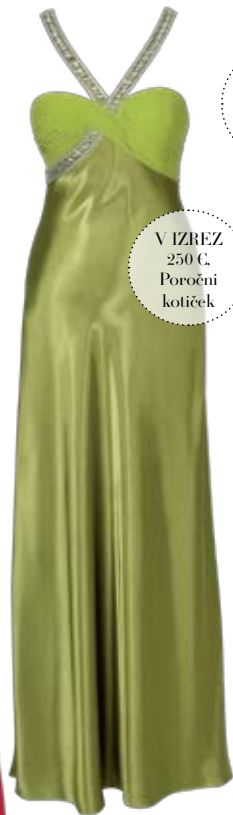
V IZREZ 250 € Poročni kotiček