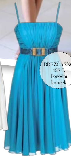
BREŽČASNO 198 € Poročni kotiček