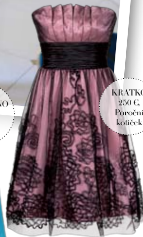
KRATKO 250 € Poročni kotiček