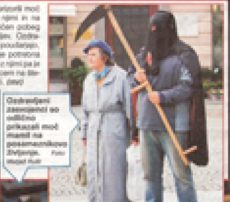
Obiskovalci satonov so lahko prikazali modni in posameznike. Foto: David Kovač

Na festivalu so predstavitelji satonov, ki so jih dijaki pripravili za svoje šole. Foto: David Kovač