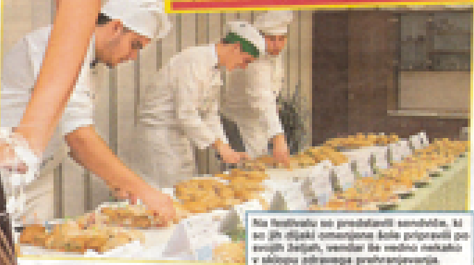
Na festivalu so predstavitelji satonov, ki so jih dijaki pripravili za svoje šole.