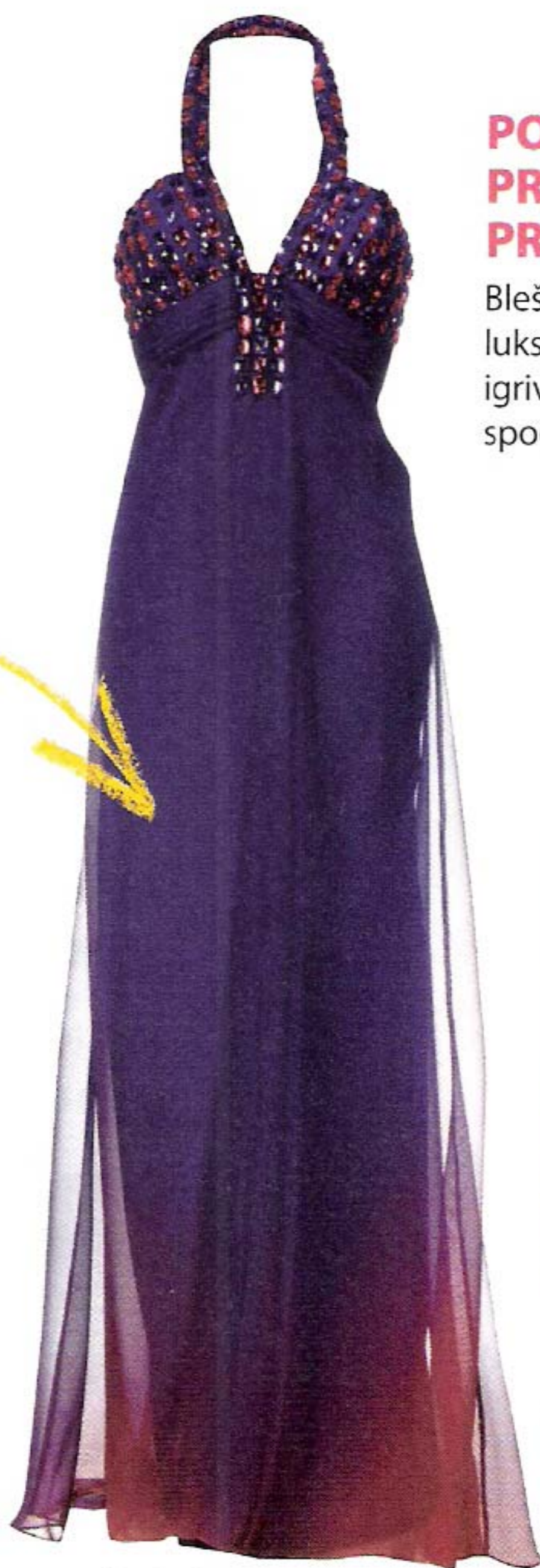
Prelivajoče barve, Poročni Kotichek (250 €)

Tvoje pismo z obrisi stopal na uredništvu pričakujemo do 8. marca, takrat bodo znane finalistke, ki bodo 10. marca vabljene na pomerjanje čevljevka in obleke.