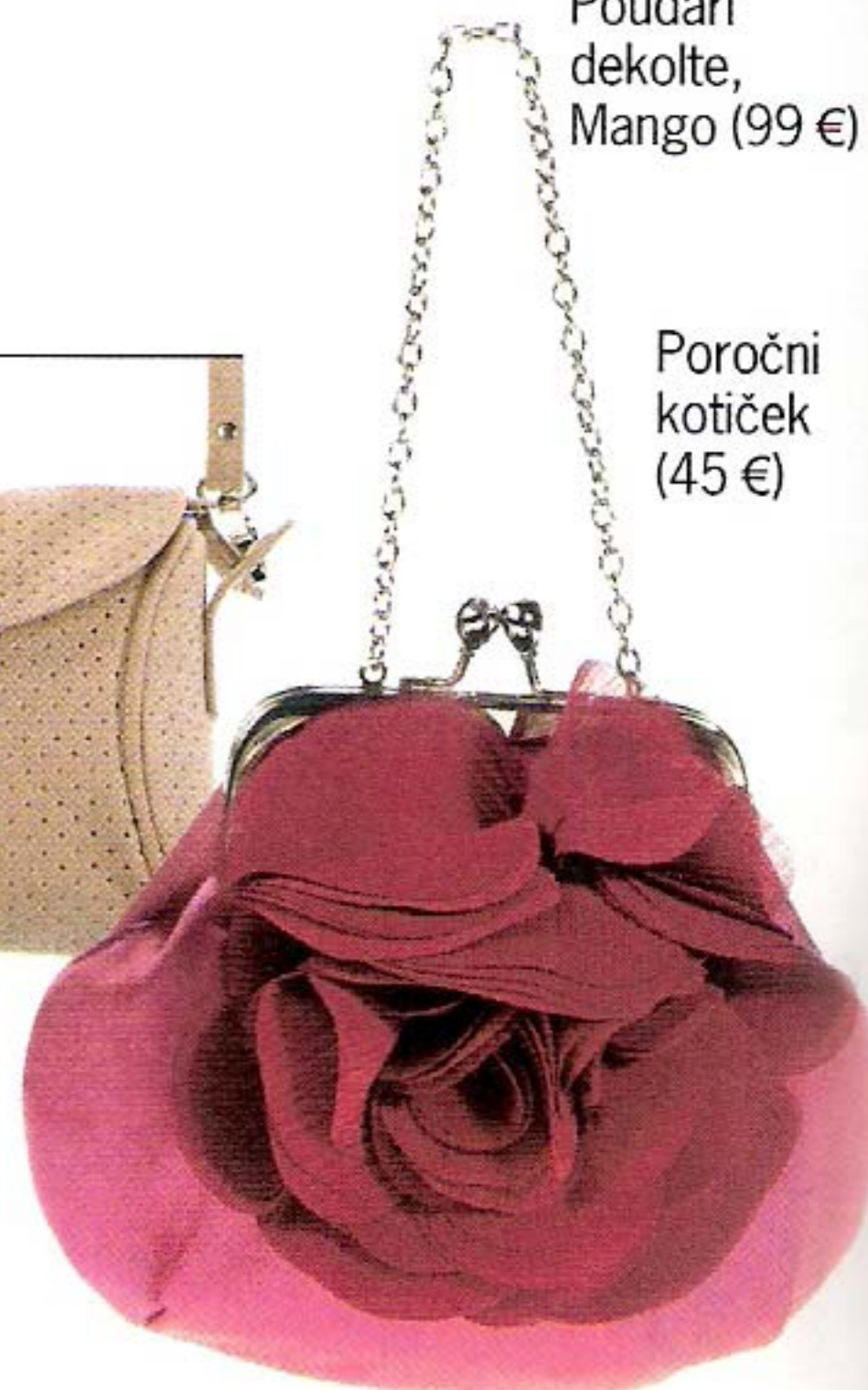
Poročni kotichek (45 €)