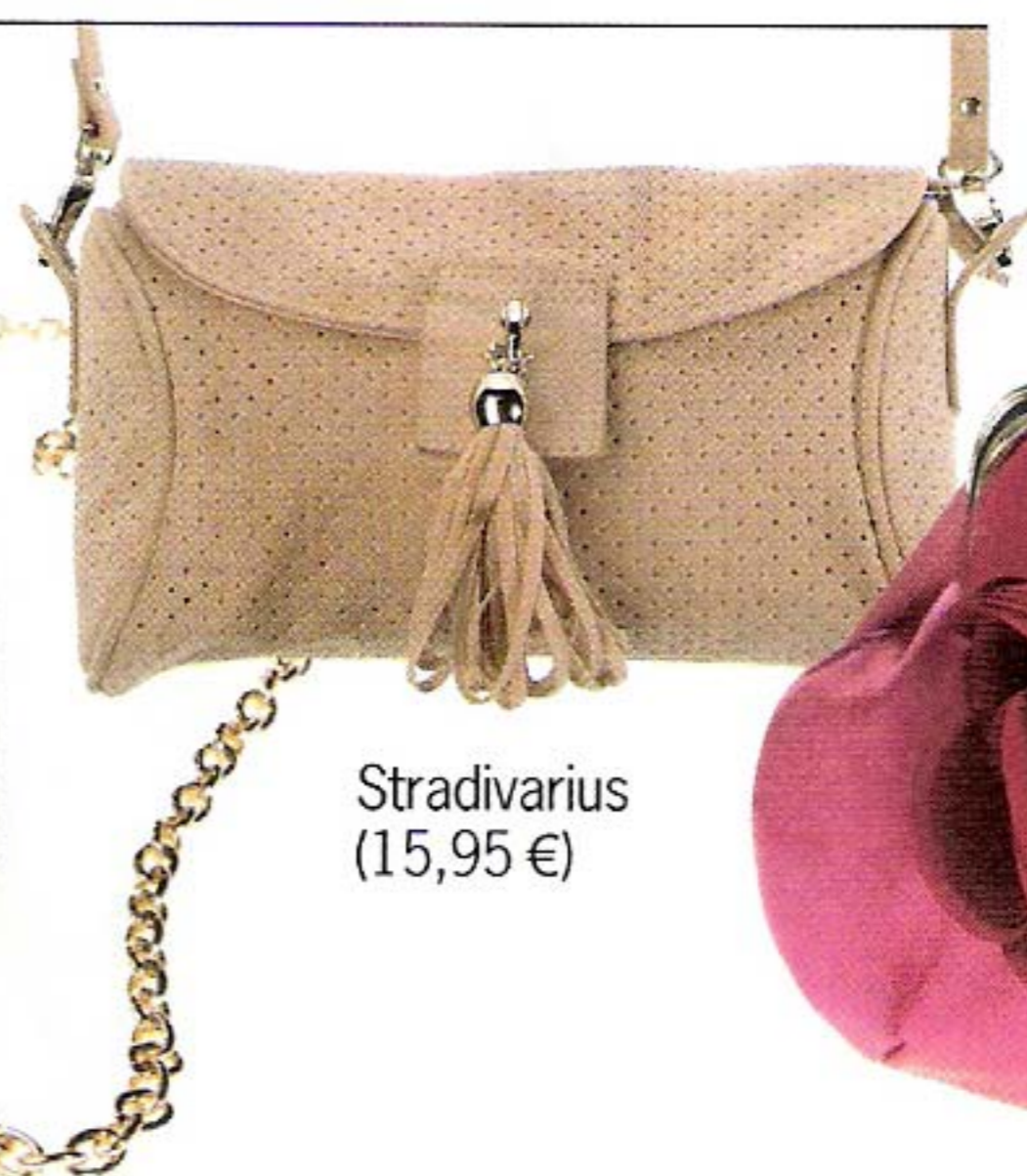
Stradivarius (15,95 €)