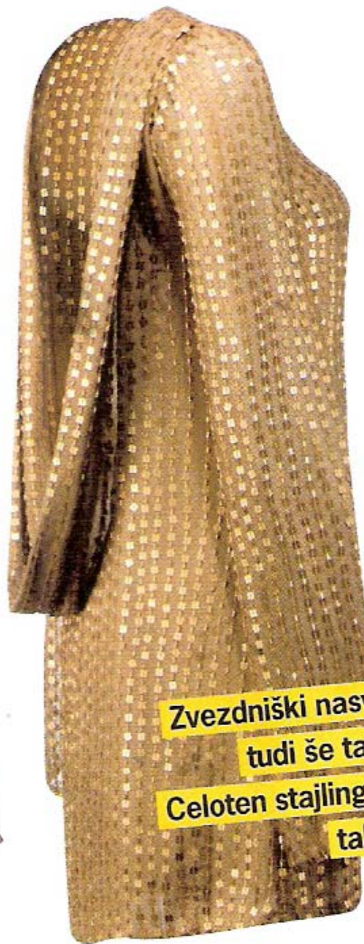
Z golim hrbtom, Nina Šušnjara (550 €)

Bleščeča oblekica je luksuzna in hkrati igriva ter ravno prav spogledljiva.