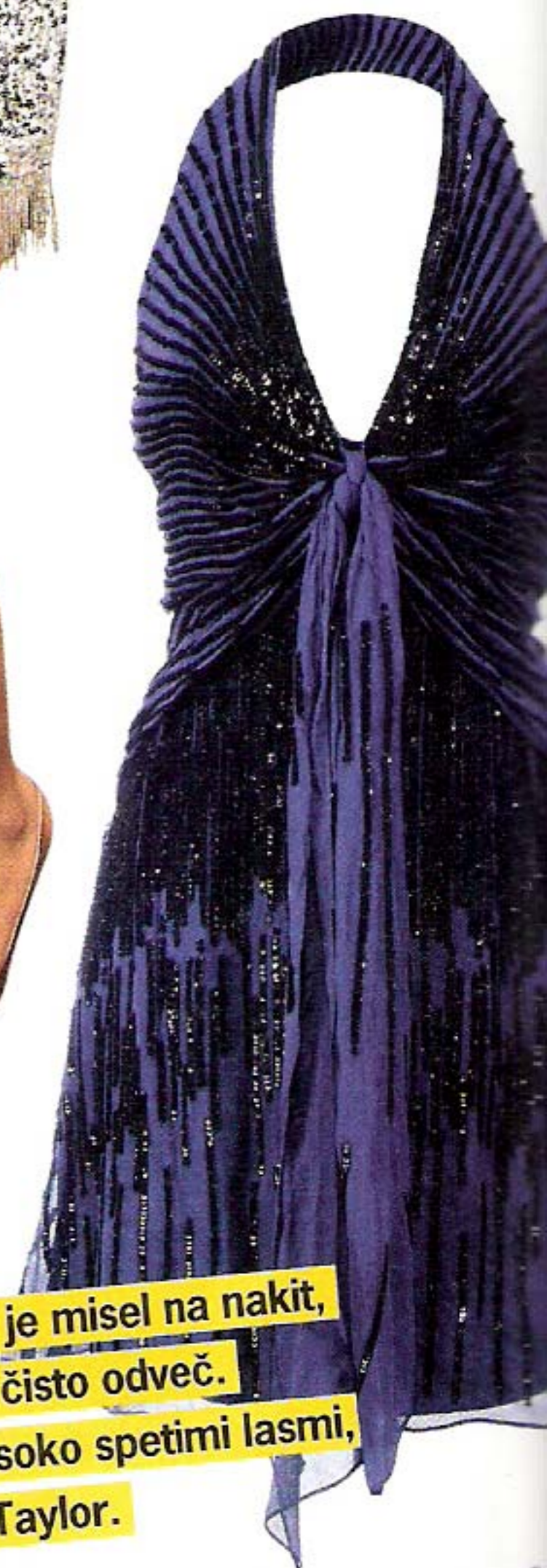
Poudari dekolte, Mango (99 €)

Zvezdniški nasvet: K takšni obleki je misel na nakit, tudi še tako minimalističen, čisto odveč. Celoten stajling boš polepšala z visoko spetimi lasmi, tako kot je to storila Taylor.